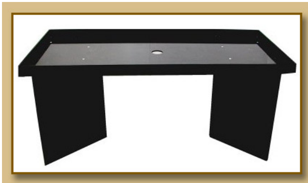
Sortiertisch / sorting table

Egg Sorting Machines for fully automatic separation of unfertilized or dead trout or salmon eggs.